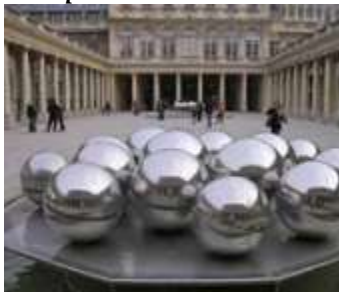
Pol Bury « les fontaines à boules »