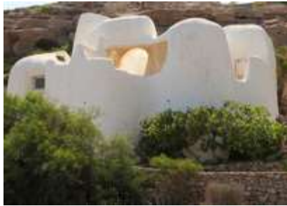
Carboneras André Bloc « sculptures habitacles »